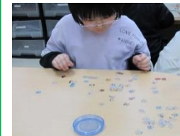
パズル、むずかしい!